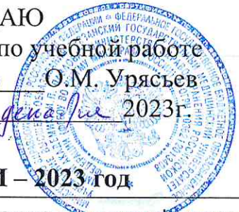
ГРАФИК ПРОВЕДЕНИЯ ПЕРВИЧНОЙ СПЕЦИАЛИЗИРОВАННОЙ АККРЕДИТАЦИИ – 2023 год